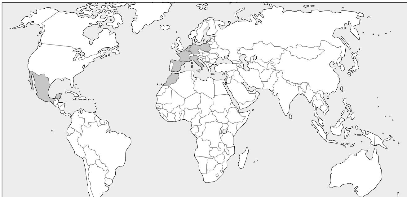
Lösungsvorschlag zu Aufgabe 1: Herkunftsländer der Erdbeeren

Üben interaktiv: Was ihr wollt!?! (Online-Code 6jp6rb)