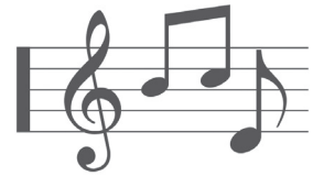
jeudi et dimanche