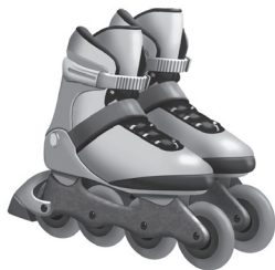
lundi et vendredi

Lundi, il y a un cours de roller. Mardi, il y a cours de skate et un match de foot. Mercredi, il y a un cours de hip-hop. Jeudi, il y a un cours de musique.