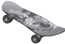
mardi et samedi