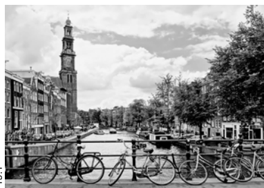
19.1 A: Niederlande

„Meine Ferien waren toll, aber die Autofahrt hat ewig gedauert. Von unserem Zuhause in Bayern bis zu unserem Ferienhaus waren wir zehn Stunden unterwegs. Als wir ankamen und ich aus dem Auto stieg, ist mir gleich die Meeresluft um die Nase geweht. Höhepunkt unserer Reise war ein Besuch in der Hauptstadt. Unglaublich, wie viele Fahrräder und Hausboote es hier gibt!“