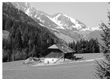
19.2 B: Schweiz

„Überall gab es Berge und zwar richtig hohe Berge! Ich war total begeistert von dieser traumhaften Winterlandschaft. Schade war, dass alle Kühe zu dieser Jahreszeit im Stall bleiben mussten und nicht wie im Sommer frei herumliefen. Wir waren fast den ganzen Tag draußen und haben uns mittags in einer Hütte aufgewärmt. Sehr kompliziert fand ich allerdings, dass wir hier nicht mit Euro zahlen konnten.“