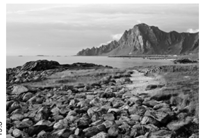
19.3 C: Norwegen

„æ, ø und å – kennst du diese Buchstaben? Ich habe sie in unserem letzten Urlaub ständig gesehen. Sie gehören nämlich zum Alphabet wie bei uns ö, ä und ü. Interessant fand ich auch, dass die Nationalflagge genauso aussieht wie die Schweizer Nationalflagge – nur kommt noch Dunkelblau dazu. Mir hat der Urlaub gut gefallen und ich würde gerne nochmal hierhin fahren. Die Strände sind wirklich toll und ich würde den ganzen Tag dort verbringen wollen.“