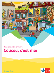
Coucou, c'est moi – Niveau deux

Chez moi – Niveau deux Mon école – Niveau deux