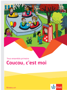
Coucou, c'est moi – Niveau un

Ces thèmes concernent les domaines de communication spécifiques du primaire et procurent aux élèves le vocabulaire et les phrases dont ils ont besoin pour réaliser les activités communicatives correspondantes. Le travail sur deux niveaux est basé sur le principe de progression en spirale, selon lequel les connaissances du niveau un sont reprises et élargies dans le niveau deux. La série Tous ensemble primaire se compose de 8 cahiers: